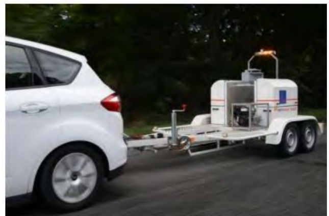
Remorque H/FWD tractée