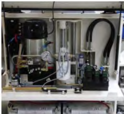
Le système de poids est 100% hydraulique, ce qui stabilise le contrôle.