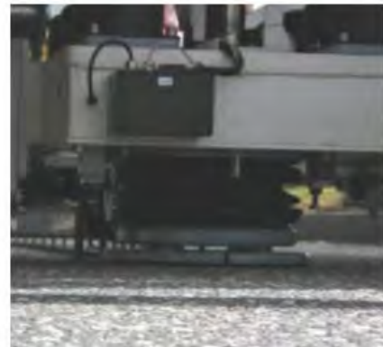
La plaque de chargement coupée en 4 permet un contact total avec la surface et des mesures précises.